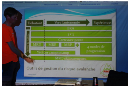
méthodes de réduction du risque