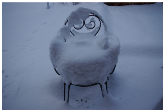
il a bien neigé cette nuit

La procédure d'inscription présente encore quelques défauts, à corriger pour la prochaine session : formulaires des listes de courses, validation des candidats... Une nouvelle procédure d'inscription est en cours de réalisation.