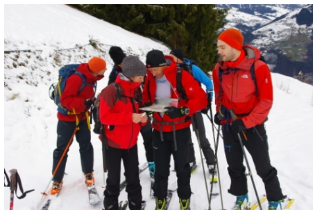
point de décision avec des débutants