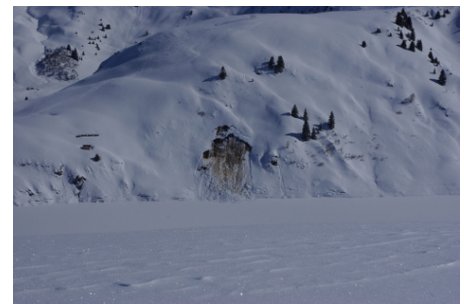
les pièges du manteau neigeux

Les conditions météo de la semaine ont été particulièrement agitées : importantes variations des températures, neige, pluie. Le BERA a oscillé entre risque 3 et 4. Il a fallu interrompre le rythme des courses, le jeudi, pour cause de forte pluie. Par mauvais temps, les participants ont réalisé des ateliers : recherche DVA, pose de main courante, entretien du matériel.