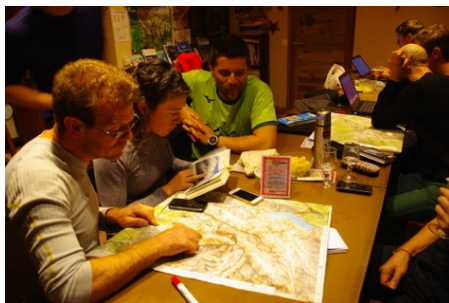
préparation d'une course avec les débutants