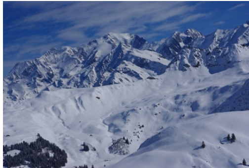
Le Mont Blanc

Par ailleurs, le contenu du stage est défini par un référentiel co-rédigé par les encadrants bénévoles et des guides.