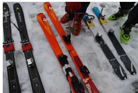
différents types de couteaux