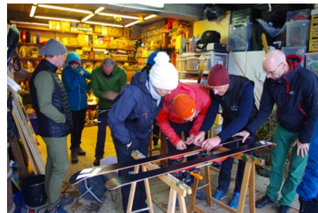
atelier de fartage