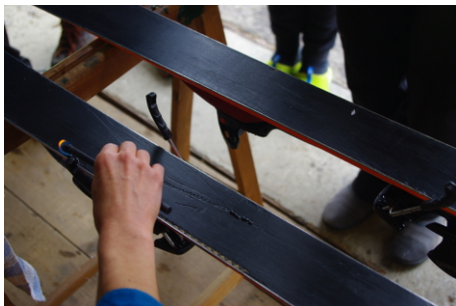
réparation des semelles