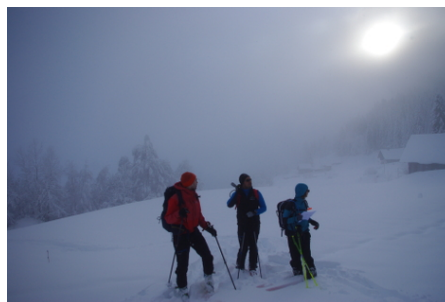
point de décision sans trace